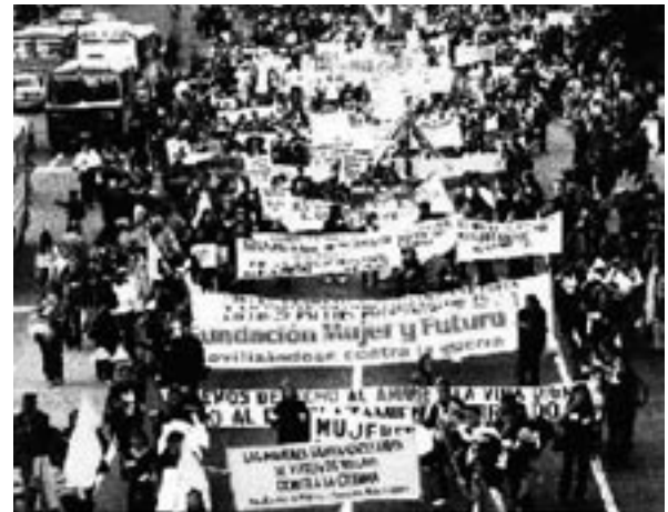
Las movilizaciones propician espacios para difundir las problemáticas de las mujeres en medio del conflicto armado y de esta forma articulan una agenda para la presión y cabildeo político.

En este contexto, las mujeres de la Ruta Pacífica nos negamos a reproducir la guerra y por esta razón hacemos presencia en aquellas ciudades y sitios donde los conflictos armados se agudizan y desde nuestra creatividad, capacidad, intelecto, astucia, magia e intuición y bajo la consigna “no parimos hijos e hijas para la guerra” construimos lenguajes y símbolos para la defensa de nuestros derechos, estrategias no violentas para contrarrestar los efectos perversos sobre las poblaciones más vulnerables.