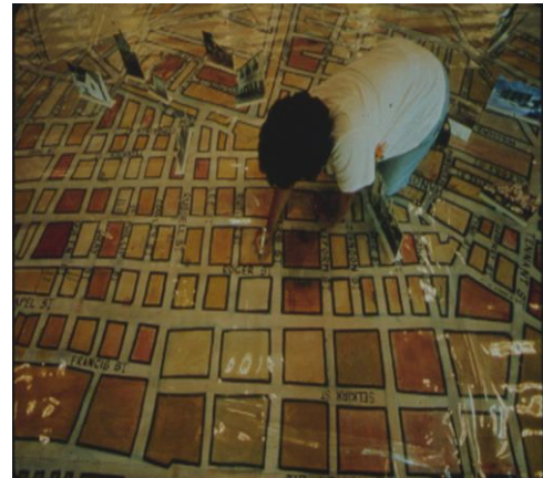
Antiguos residentes marcan sus hogares en un mapa en el Museo del Distrito Seis

En Ciudad del Cabo, Sudáfrica el Museo District Six creó un sitio comunitario en constante funcionamiento, para el recuerdo y fortalecimiento que sirvió como base de compensación material para las víctimas del apartheid. En 1966, el “Distrito Seis”, un vecindario integrado racialmente, fue arrasado completamente para hacer sitio para una urbanización “sólo para blancos”. Las únicas construcciones que pudieron mantenerse fueron las destinadas a los cultos. Un grupo de antiguos residentes pusieron en el piso de una iglesia metodista que no había sido destruida, un mapa que detallaba el destruido vecindario, e invitaron a sus vecinos a que colocaran sus casas, calles, tiendas y espacios comunales en el mapa. Este proyecto de creación de un mapa en base a recuerdos constituyó la base de demandas de reclamación de tierras.