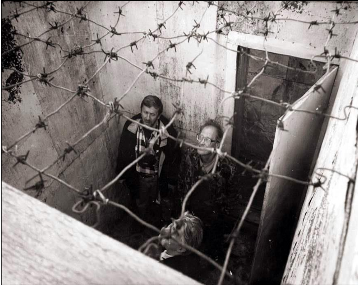
Museo Gulag de Perm-36

Algunos sitios, particularmente aquellos que representan a los gobiernos, como el U.S. National Park Service, o instituciones más grandes, como el British National Trust, les preocupaba que se les tildara de muy “políticos” al ser sitios de concienciación. Por “político” ellos implicaban explícitamente defender una posición específica sobre un tema contemporáneo, como, por ejemplo, quién debe recibir asistencia social y por cuánto tiempo, o quién tiene derecho a inmigrar a los Estados Unidos. Por el contrario, pretenden funcionar como un foro contemporáneo de debate abierto a todas las posiciones, teniendo cuidado de plantear las preguntas con una variedad de posibles respuestas. Para muchos esto significaba incluir múltiples perspectivas en sus narrativas, como en el audio de introducción del Museo Tenement para la exposición de “los talleres de explotación obrera”, dando a conocer las voces de los trabajadores, contratistas, diseñadores y organizadores de los sindicatos. Para otros, esto significaba invitar a participantes que tenían distintas perspectivas para intercambiar experiencias en estos sitios, como cuando el Museo Gulag reunió a los antiguos prisioneros y guardias para reencontrarse y confrontar sus historias, o cuando el Japanese American National Museum invitó a los agentes del Immigration and Naturalization Service (Servicio de inmigración y naturalización) y a un antiguo interno para hablar sobre temas raciales.