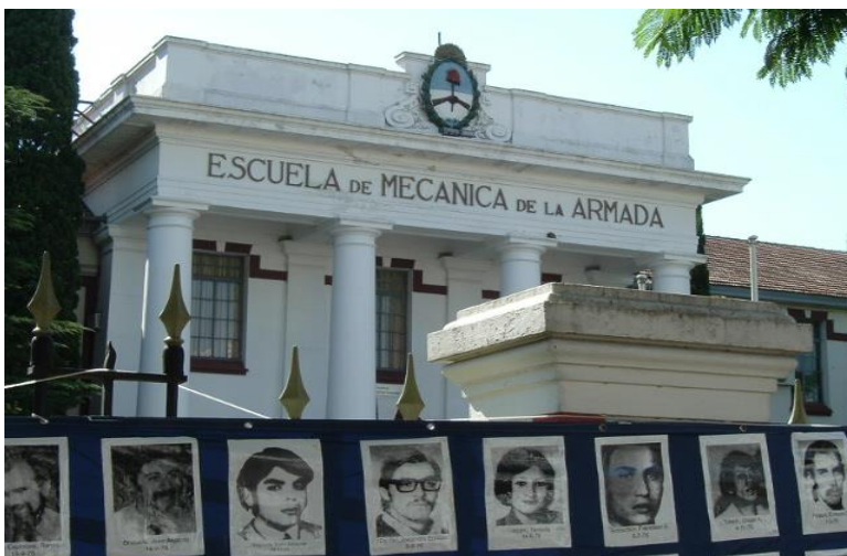
Antigua Escuela Naval y centro de tortura que se convertirá en el nuevo Museo de la Memoria en Buenos Aires

La primera vez que nos vimos nos sorprendimos al ver que la mayoría de nosotros no