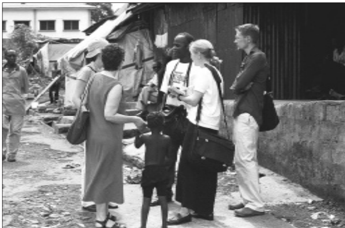
Команда Minnesota Advocates проводит исследование условий, существующих в центре для жертв увечий в Сьерра-Леоне