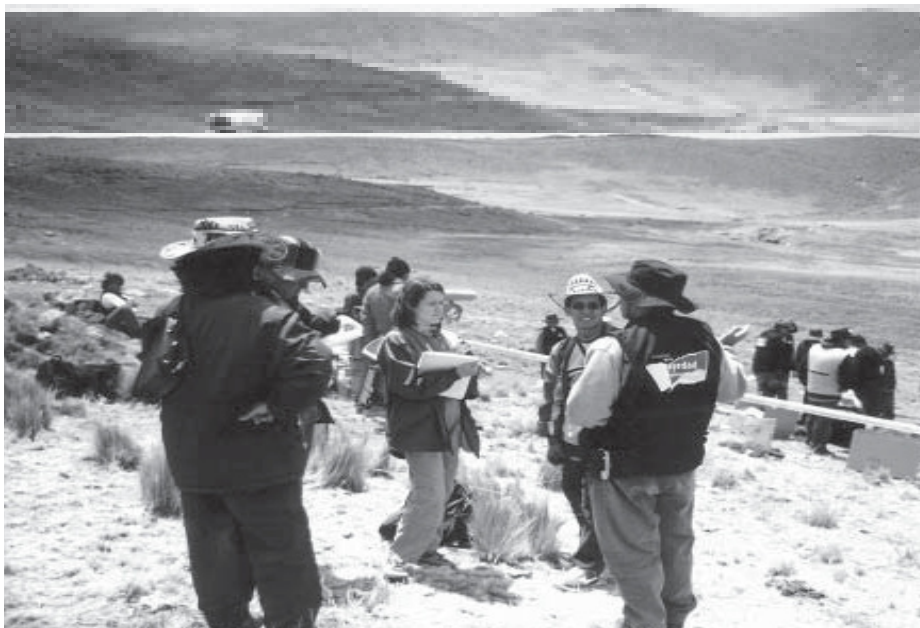
Волонтерка Minnesota Advocates наблюдает за выполняемой Комиссией Правды и Примирения в рамках ее действий эксгумацией массовых захоронений в Луканамарка, Перу.

Летом 2002 г. перуанская неправительственная организация