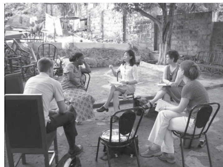
Команда и волонтеры Minnesota Advocates проводят интервью во Фритаун, Сьерра-Леоне.

в пользу прав человека Paz y Esperanza обратилась к Minnesota Advocates с просьбой направить группу международных наблюдателей, которые будут участвовать в работе Комиссии Правды и Примирения ( Truth and Reconciliation Commission -TRC ) в Перу. Paz y Esperanza считала, что присутствие международного мониторинга прав человека поможет обратить внимание масс-медиа на работу TRC и окажет давление на правительство по внедрению рекомендаций TRC. Мандат перуанской TRC предполагал исследование причин и объем нарушений прав человека, осуществленных во время трех отдельных правлений в период с 1980 по 2000 г. TRC должна была также опубликовать заключительный отчет о своей работе, содержащий рекомендации учредительных реформ и компенсаций для жертв.