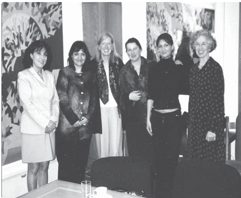
Команда и волонтеры Minnesota Advocates Women's Program с болгарскими деятельницами женских движений и представительницами законодательной власти.

Деятели и волонтеры Minnesota Advocates побывали в Болгарии в марте 2003 года для участия во встречах с парламентариями и журналистами по вопросам предложенных изменений в предписаниях. Журналистские интервью концентрировались на предлагаемых регулирований и способе, каким подобные решения были введены в Миннесоте. Очередной раз деятели и волонтеры Minnesota Advocates приехали в Болгарию в октябре 2003 года, чтобы