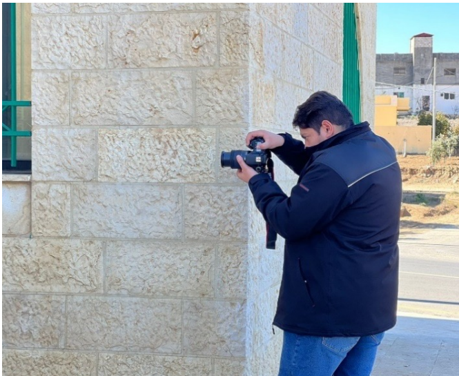
الشكل 1: احد أعضاء جمعية الطفيلة الخيرية النسائية يلتقط صوراً للمواقع الأثرية.

نتيجة لذلك، تمكن الفريق من إعداد الدليل بنسخته الورقية والإلكترونية مستهدفاً المجتمع المحلي والسائحين وزوار الفنادق والمناطق السياحية، تم توزيع نسخة لمديرية الآثار وشرطة العاصمة لديها عدد من النسخ والجمعية تقوم بتوزيعه خلال الفعاليات للجمعية وزوار الجمعية وقد تم توزيع أكثر من 150 نسخة، تم رفع نسخته الإلكترونية على موقع جمعية سيدات الطفيلة ويتم عرض محتواه على صفحة الحملة على الفيس بوك وقد وصل عدد المشاهدات إلى ما يقارب الـ 35 ألف مشاهدة.