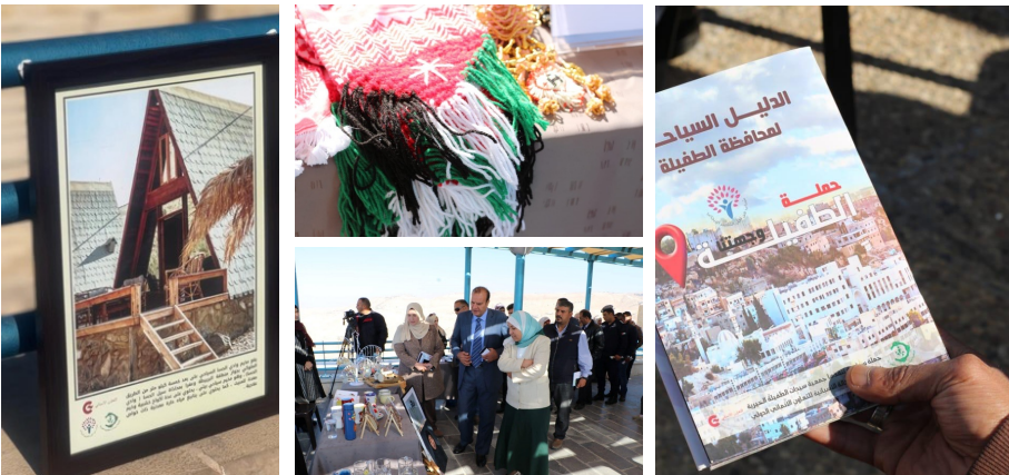
الشكل ٢: صور من فعالية اليوم المفتوح