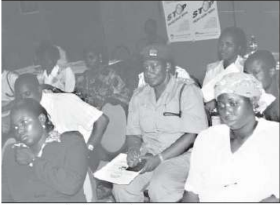
Participants and audience members

ও করে। এই বিশাল কর্মকান্ড পরিচালনার জন্য আমরা আমাদের সংগঠনের এবং কর্মচারীদের দক্ষতা মূল্যায়ন করি। এমন নির্বাহী পরিচালক এবং আমাদের স্টাফের তিনজন সদস্য শুরু থেকেই পরিকল্পনা প্রণয়ন এবং বস্ত্রগত সাহায্য প্রাপ্তির বিষয়ে বিশেষ ভাবে দায়িত্ব পালন করেন। প্রাথমিকভাবে BAOBAB প্রকল্পের সঙ্গে একই সঙ্গে কার্যক্রম পরিচালিত হয় কিন্তু পরবর্তীতে BAOBAB এর ১৪ জন কর্মচারী ট্রাইবুনালের কার্যক্রম সম্পন্ন না হওয়া পর্যন্ত সপ্তাহ অন্যান্য প্রকল্পের কার্যক্রম সাময়িকভাবে স্থগিত রাখেন। আমরা বিশ্বাস করি যে, এই সম্পদের জন্য প্রদত্ত প্রতিশ্রুতি এবং লোকবল খুবই প্রয়োজনীয় এবং সমর্থনযোগী। আমরা এও শিখলাম সঠিক জীবন-কাহিনী সংগ্রহ করাটাই লোককে বুঝাবার জন্য প্রকৃষ্ট উপায়। ছোট সংগঠনের পক্ষে এ ধরনের কাজ করতে গেলে আগে ভাগে অর্থ সংগ্রহ করা উচিত অন্যথায় একই সঙ্গে নির্ধারিত সূচী অনুযায়ী অন্য কাজ করতে তাদের কর্মচারী সক্ষম হবে না।