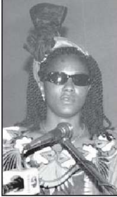
This woman chose to cover her eyes while testifying

আশা করি আপনার নিজের ক্ষেত্রে উপযুক্ত বিশ্লেষণের জন্য আমাদের অবলম্বিত প্রতিটি কৌশলের প্রতিফলন ঘটবে। ক্ষতিগ্রস্ত ব্যক্তি কতক স্বেচ্ছায় সাক্ষ্য দানের অভিপ্ৰায় :