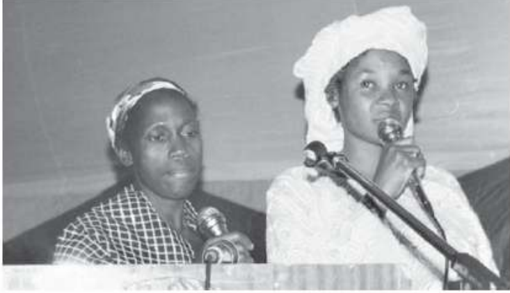
This young woman chose to speak without disguising her identity

আপনার সংগঠন কি যথেষ্ট মাত্রায় উচ্চ পর্যায়ের জাতীয়ভাবে মর্যাদাশীল ব্যক্তিদের নিয়ে বিচারপতি প্যানেল নির্বাচন করতে সক্ষম? খ্যাতিমান সুপরিচিত