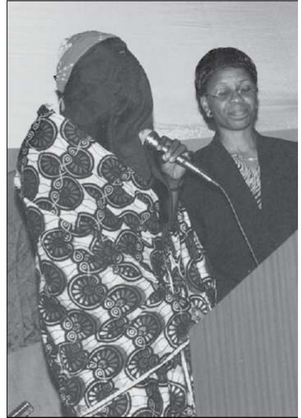
Some women chose to hide their identities while testifying. This woman covered herself completely.