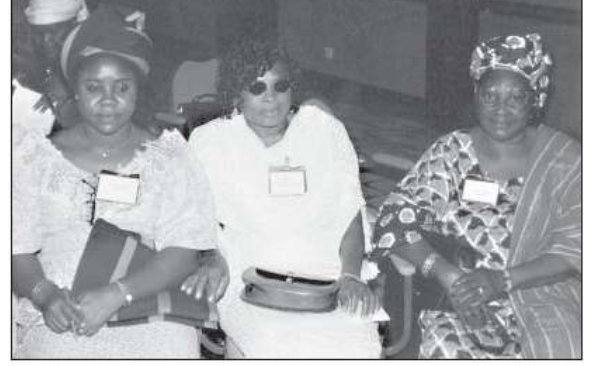
Women at the tribunal

দুটো সংগঠনের অবস্থান গত দূরত্ব অনেক সময় একটা বাধা হয়ে ওঠে। CIRDDOC পূর্ব নাইজেরিয়ায় ইনুগু ভিত্তিক একটি সংগঠন বা নাইজেরিয়ার প্রাক্তন রাজধানী লাগাম যেখানে এর কার্যালয়, যেখান হতে ঐ অফিস ৮ ঘন্টায় দূরত্ব। আমরা একবারই সাক্ষাতের সুযোগ পাই। বাকী কাজ নই-মেইন এবং ফোনের মাধ্যমে সম্পন্ন করি।