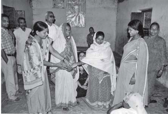
विवाद समाधानपछि विवादित पक्षहरू हात मिलाउँदै