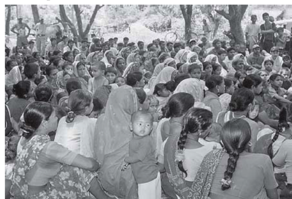
सचेतना तथा आम भेलामा सहभागी स्थानिय बासिन्दाहरू

गाविसमा आमभेला सम्पन्न भएपछि वडा स्तरीय अन्तरक्रिया कार्यक्रमहरूको आयोजना गरिन्छ। यसमा मुख्यगरी कार्यक्रम सञ्चालन, मध्यस्थता समितिहरूको गठन तथा मध्यस्थकर्ताहरूको चयनसम्बन्धी छलफल हुन्छ। यस छलफलमा पनि आम भेलामा भएकै विषयमा