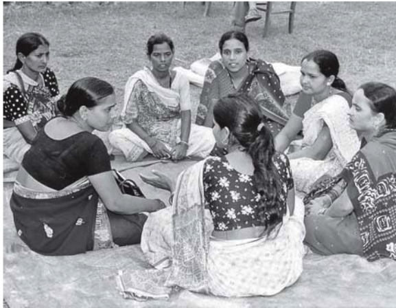
महिला मध्यस्थकर्ताहरू छलफल गर्दै

हामीले यहाँ महिलाहरूको घरायसी काम तथा पारिवारिक भूमिकालाई ध्यान दिनुपर्ने हुन्छ र यसलाई हामीले प्रमुख प्राथमिकता पनि दिने गरेका छौं । अन्यथा महिलाहरूले कार्यक्रममा सहभागिता हुन सक्ने छैनन् । तसर्थ महिलाहरूसँग बसी उपयुक्त दिन र समयको पहिचान गर्ने र सोअनुरूप योजना तथा कार्यक्रम तय गर्ने गर्दछौं। यसले गर्दा महिला अनुपस्थितिलाई घटाएको र महिला सहभागिता बढाएको छ । यसप्रकार विभिन्न छलफल, अन्तरक्रिया तथा तालिम कार्यक्रमहरू बहुसंख्यक महिलाहरूलाई उपयुक्त हुने दिन र समयमा सञ्चालन गर्ने गरेका छौं । उदाहरणको लागि सामान्य भेटघाट कार्यक्रम विदाको दिन दिउँसोको समयमा सञ्चालन गर्ने गर्दछौं । यस्तै तालिम वा अन्य केही लामो समय लिने कार्यक्रमहरू वर्षा, रोपाईं, कटाई, चाडपर्व आदि मौसममा नपर्ने गरी सूचीकृत गर्दछौं । साथमा मुख्यगरी हामी ती महिलाहरूका श्रीमान र परिवारलाई उनीहरूको घरायसी लगायतका कार्यहरूमा सहयोग गरी बाह्य कार्यक्रममा सहभागी हुने समय मिलाईदिन अनुरोध पनि गर्ने गर्दछौं । यसले ती महिलाहरूलाई धेरै हदसम्म सजिलो भएको छ र जनजीवनमा समग्र सहभागिता र सम्मिलनको अवस्थालाई फराकिलो बनाएको छ ।