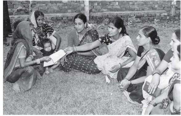
महिला मध्यस्थकर्ताहरू एउटा समस्या सम्बन्धि छलफल गर्दै

पितृसत्तात्मक संस्कृति र नीति निर्माण तहमा महिलाको आवाजको सुनुवाई नहुनु नै लैङ्गिक समानताका लागि दुई प्रमुख व्याधानहरू हुन्। २ संयुक्त राष्ट्रसंघीय विकास कार्यक्रम (यूएनडीपी) ले नेपाल मानव विकास प्रतिवेदन २००२ मा स्पष्ट रूपमा भनेको छ— लैङ्गिक समानता, महिला सशक्तिकरण तथा उनीहरूको स्रोत तथा साधनमाथिको पहुँच आदि सन्दर्भमा नीतिनियमहरू भएता पनि स्रोतसाधनको अपर्याप्त परिचालन र सरकारको प्रभावकारी भूमिकाको अभावमा समाजका कमजोर वर्गको अवस्था ज्यूँका त्यूँ छ। अपवादका रूपमा केही क्षेत्रहरू जस्तै उपभोक्ता समिति, सामुदायिक तथा सरकारी संघसंस्थाहरूमा महिला तथा विपन्न वर्गको सहभागिताको व्यवस्था गरिएतापनि यो सामान्यतः देखावटी जस्तो मात्र भएको छ। ३ महिला र पिछड्याइएका वर्ग न त आफ्नो अधिकारबारे सचेत छन् न त उनीहरू चरम गरीबी