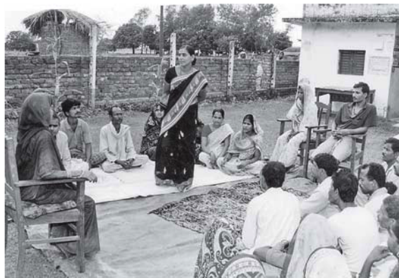
सप्तरी जिल्लामा मध्यस्थता सभालाई सम्बोधन गर्दै एक महिला मध्यस्थताकर्ता

सिभिकटले सन् २००१ बाट यो कार्यको थालनी मानवअधिकार तथा मध्यस्थता समितिको गठनबाट शुरु गरेको हो। यस समितिमा समुदायका पुरुष र महिलाको समन्वयात्मक सहभागिता रहेको हुन्छ जस्तै: न्यूनतम २५ प्रतिशत महिला र उपयुक्त प्रतिशत अंश पिछड्याइएका जनसंख्याको प्रतिनिधित्व हुने गर्दछ। यस रणनीतिअन्तर्गत महिला समितिहरूको गठन पनि भएका छन्। यसले महिलाहरूलाई विभिन्न मुद्दाहरू उठाउन सक्षम बनाएको छ जुन सामान्यत: मिश्रित लैंगिक समितिमा प्रस्तुत गर्न असजिलो हुने गर्दथ्यो। यसप्रकार यी दुवै मध्यस्थता समिति र महिला समितिले उपरोक्त तीनै जिल्लामा न्यायमा पहुँचको सुधार गर्दै आएका र समुदायको सशक्तिकरणमा समेत योगदान पुऱ्याउँदै आएका छन्।