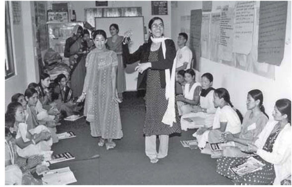
मध्यस्थकर्ता तालिममा प्रशिक्षार्थीहरू मनोरञ्जन गर्दै

उम्मेदवार छनौट भई तालिमको लागि सिफारिश भएपछि स्थानीय सहमतिको आधारमा तालिमका लागि उपयुक्त मिति, समय र स्थान निश्चित गरिन्छ। मध्यस्थताको तालिममा मानवअधिकार, आधारभूत कानून र मध्यस्थतासम्बन्धी सीप सिकाइन्छ। यो तालिम सामान्यतः ४० देखि ४८ घण्टाको हुन्छ र यो छ दिनको आवासीय तालिमको रूपमा दिइन्छ। यसपछि वर्षको दुई पटक २० देखि २४ घण्टाको तीन दिन पुनर्ताजगी तालिम दिइन्छ। पुनर्ताजगी तालिम मध्यस्थता समितिले