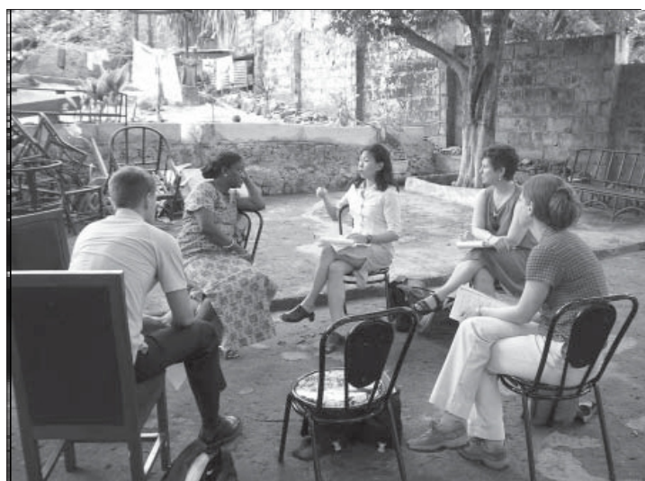
Zespół i wolontariusze Minnesota Advocates przeprowadzają wywiad we Freetown, Sierra Leone.

i opublikowane obserwacje jego autorów wspierają integralność całego procesu oraz zapewniają moralne i emocjonalne wsparcie dla ofiar, które podejmują trudną decyzję o złożeniu zeznań, wreszcie legitymizują proces rozliczenia z reżimem poprzez zwrócenie nań uwagi społeczności międzynarodowej. Ponadto monitoring praw człowieka może być także środkiem wywierania presji na rząd, aby zastosował się do rekomendacji komisji prawdy i pojednania.