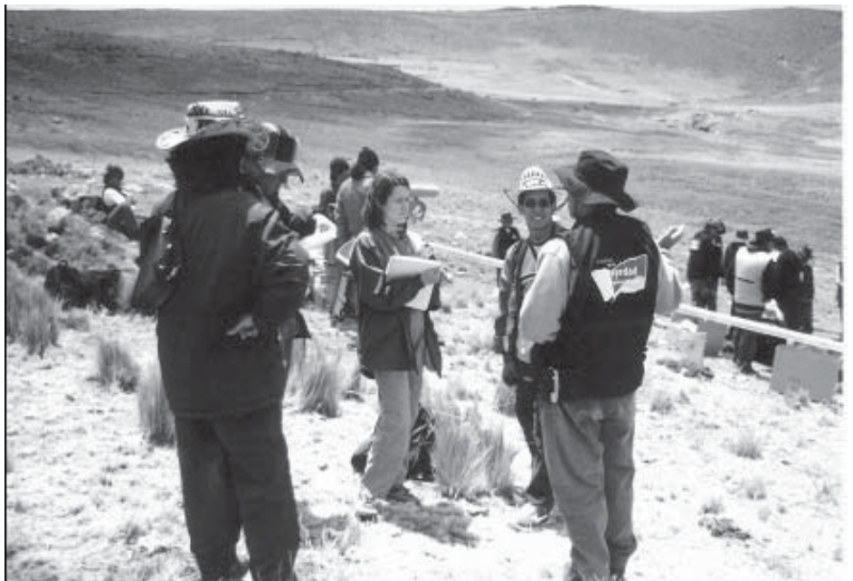
Wolontariuszka Minnesota Advocates obserwuje dokonywaną przez Komisję Prawdy i Pojednania w ramach jej działań ekshumację masowych grobów w Lucanamarca, Peru.

Monitorng praw człowieka może odegrać zasadniczą rolę w powodzeniu tego procesu. Wyniki monitoringu praw człowieka