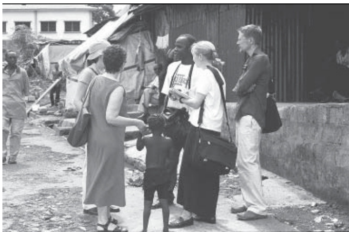
Zespół Minnesota Advocates przeprowadza badanie warunków panujących w obozie dla ofiar okaleczeń w Sierra Leone