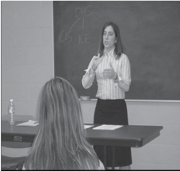
W ramach działań rzeczniczych i edukacyjnych Projektu Dokumentacji Przemocy Wobec Imigrantek działaczka Minnesota Advocates przeprowadziła szkolenie z zakresu prawa imigracyjnego podczas Central Minnesota Conference on Domestic Violence and Immigration (kwiecień 2004 r.)

Zespół opracowujący raport składał się z dwójga pracowników oraz trzech wolontariuszy - prawników, którzy byli zaangażowani w projekt na etapie przeprowadzania rozmów. Przyjęta metoda pracy zakładała przeprowadzenie (w pewnym określonym zakresie) porównania pomiędzy sprawami, w których ofiarami były kobiety będące imigrantkami i uchodźczyniami oraz nienależące do tych grup. Metoda ta została zastosowana wyłącznie po to, aby podkreślić sposób, w jaki - w pewnych szczególnych okolicznościach - działania w zakresie pomocy prawnej i społecznej podejmowane przez władze nie odpowiadały na specyficzne potrzeby ofiar przemocy domowej będących uchodźczyniami lub imigrantkami. Punktem odniesienia było jednak prawo międzynarodowe a nie poziom ochrony i wsparcia zapewniany kobietom nie będącym imigrantkami.