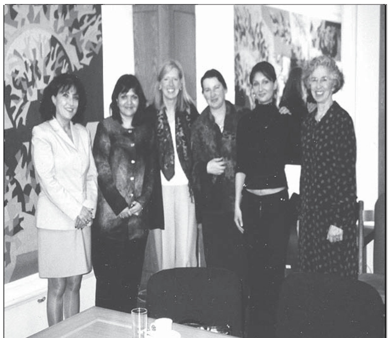
Zespół i wolontariuszki Minnesota Advocates Women's Program z bułgarskimi działaczkami kobiecymi i przedstawicielkami władz ustawodawczych.

Ustawa została przyjęta w pierwszym czytaniu przez parlament bułgarski w dniu 30 czerwca 2004 r., drugie czytanie